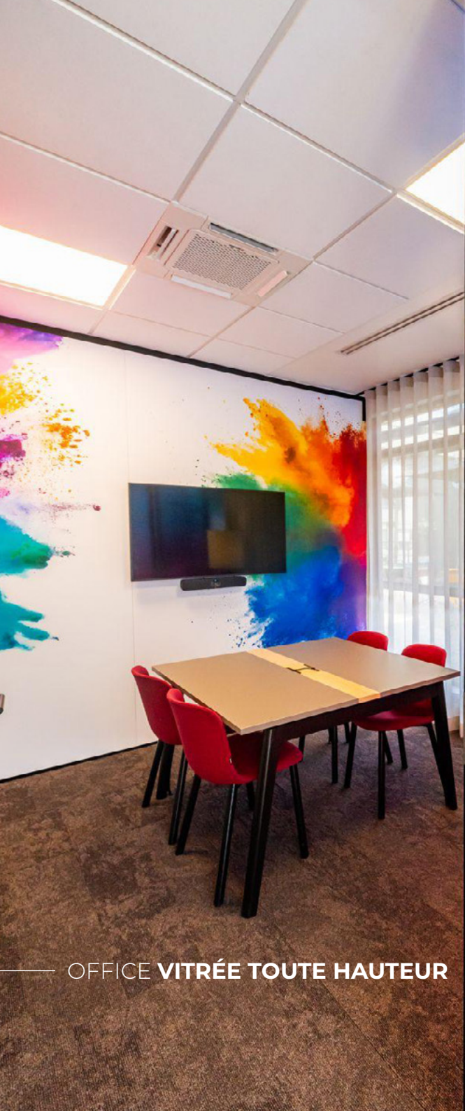
OFFICE VITRÉE TOUTE HAUTEUR