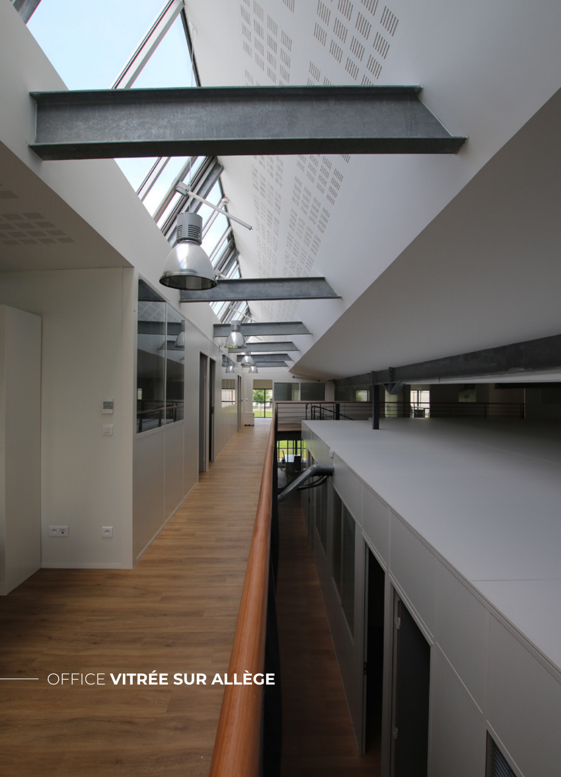
— OFFICE VITRÉE SUR ALLÈGE