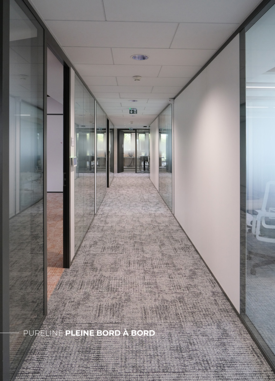
PURELINE PLEINE BORD À BORD